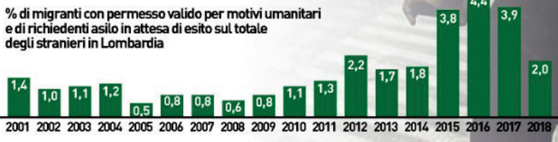
Fonte: elaborazioni su dati Orim, 2017-2018