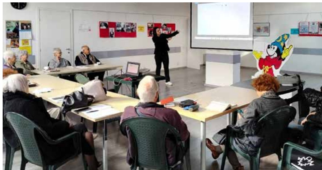
A destra, una lezione dei corsi di formazione al digitale organizzata dai circoli Acli

della Difesa Guido Crosetto. Il truffatore convinse diversi di loro a versare soldi su conti correnti esteri, convincendoli che il loro contributo sarebbe stato essenziale per liberare giornalisti italiani rapiti in Medio Oriente. «Sembrava assolutamente tutto vero. Comunque, può capitare, poi certo uno non se l'aspetta una roba di questo genere», affermò al tempo l'ex presidente dell'Inter Massimo Moratti, una delle vittime più note di questa truffa, contattato dai giornali dopo aver versato quasi un milione di euro. ■